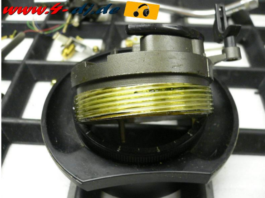
Bild von einer total verharzten Base Unit Vorher

Die Tonarm Unit wird zerlegt, entfettet,