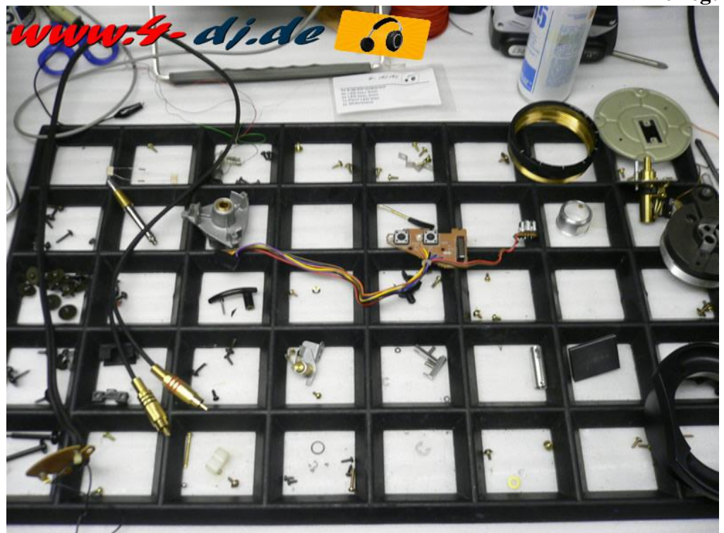
Gerät in Einzelteile zerlegt