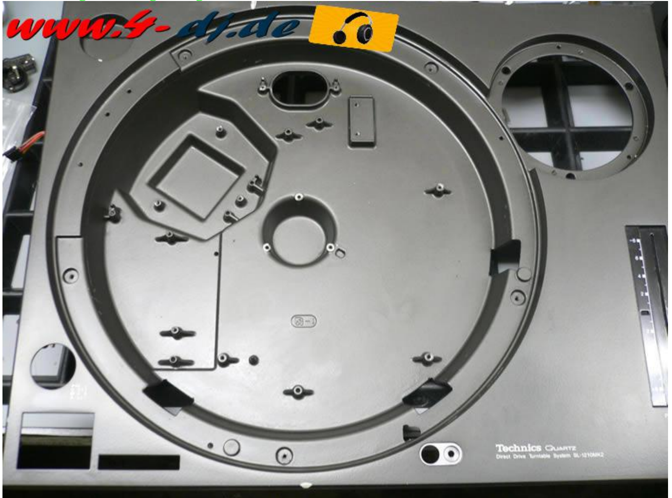
Oberteil gereinigt und mit Gehäusespray behandelt