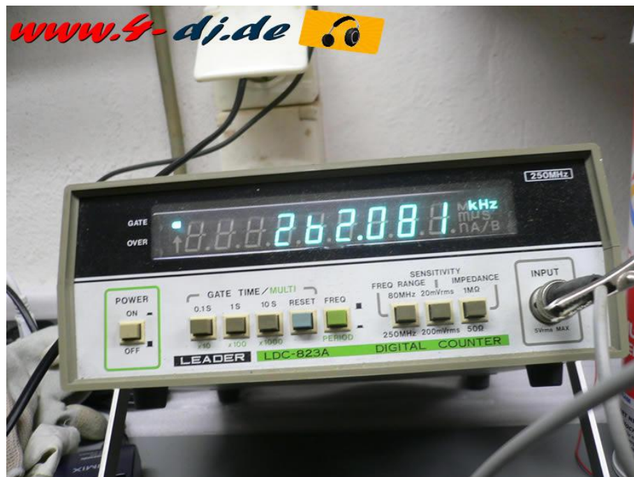
Bild Abgleich der Geschwindigkeit / Pitch Control Adjustment