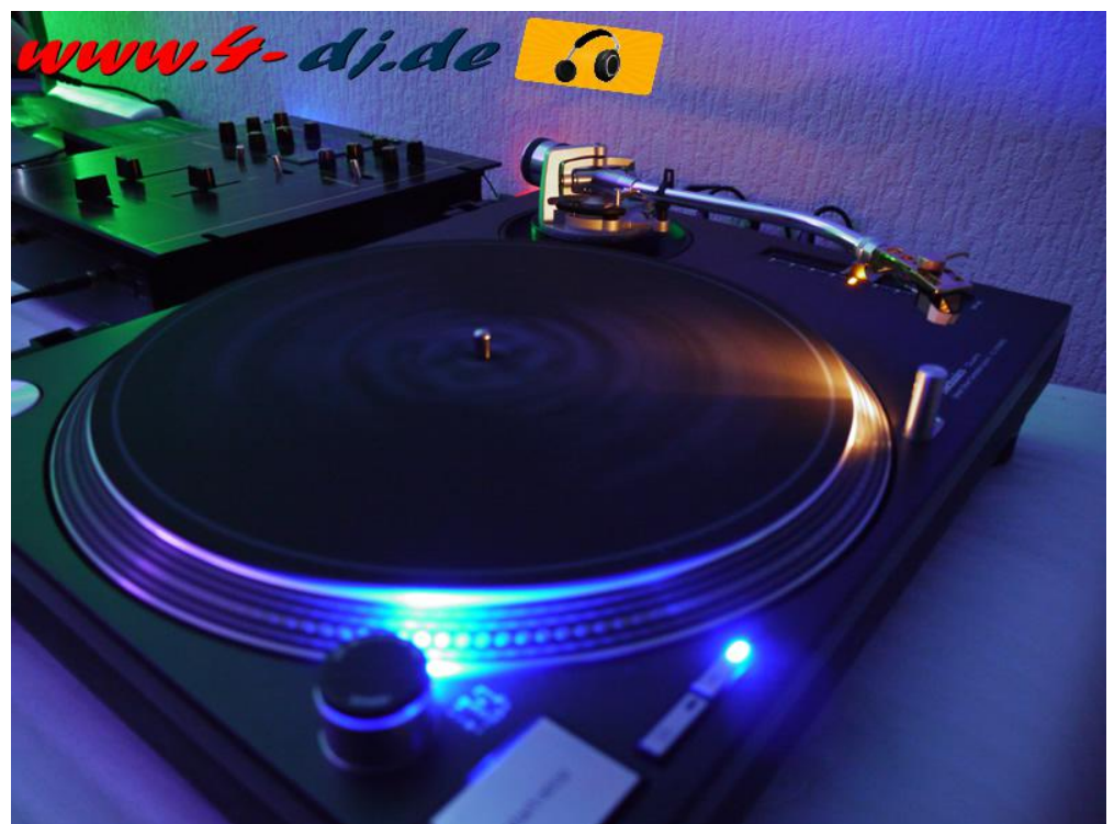
NightView 4-dj.de Showroom