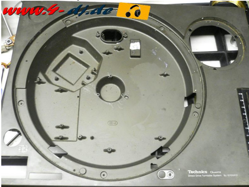
Oberteil vor unserem Service

Die Geräte werden komplett in Einzelteile ->>