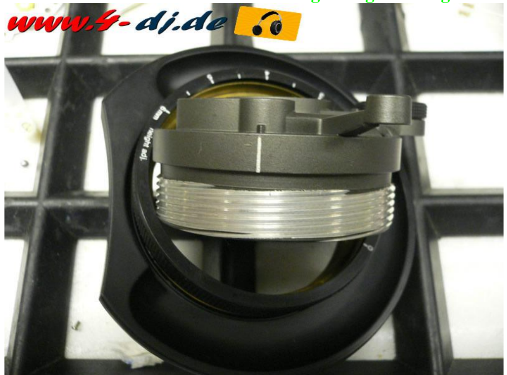
Bild von der Base nach unserem Service